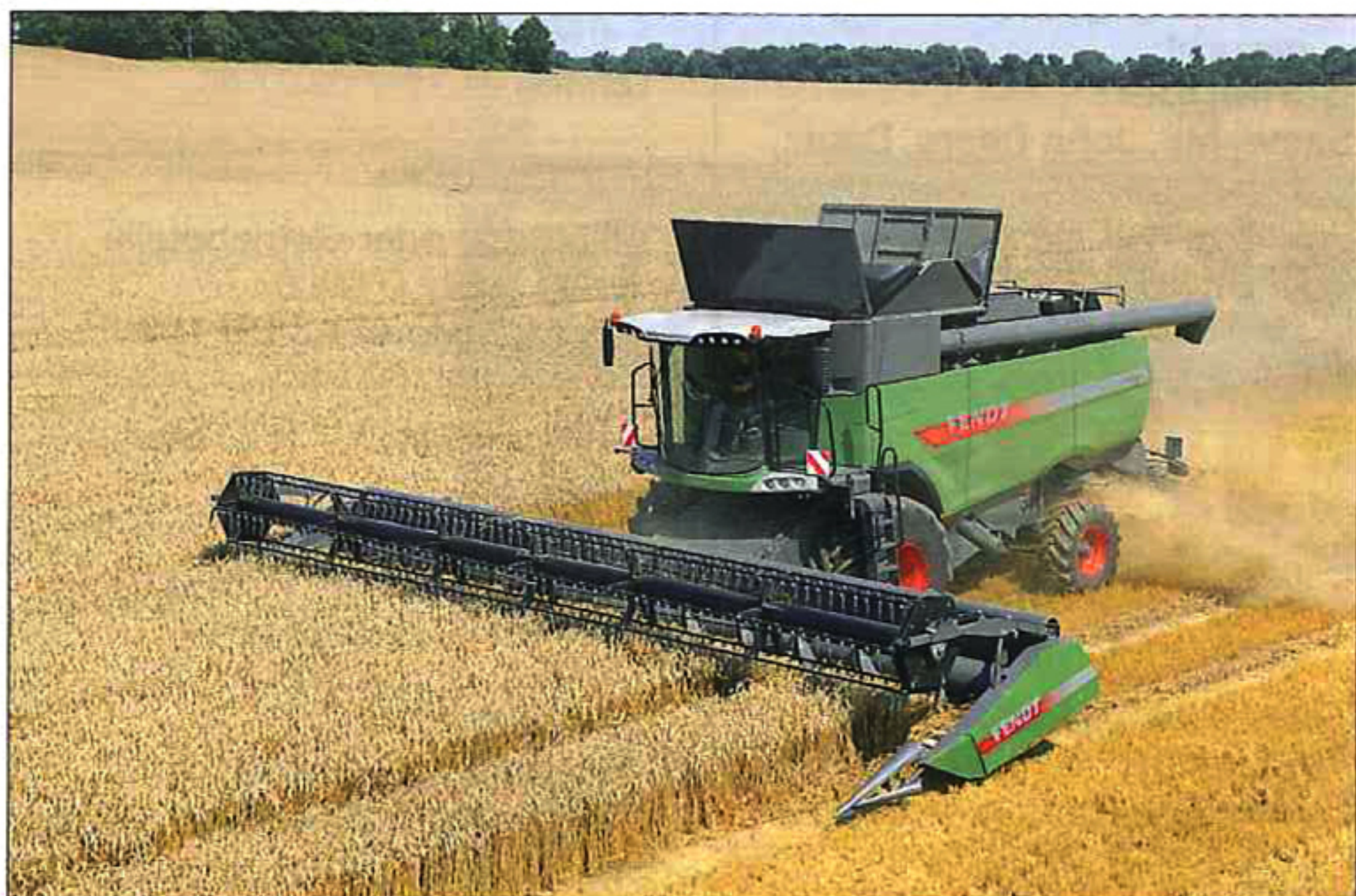
Fendt 9490 X im Einsatz im Weizen.