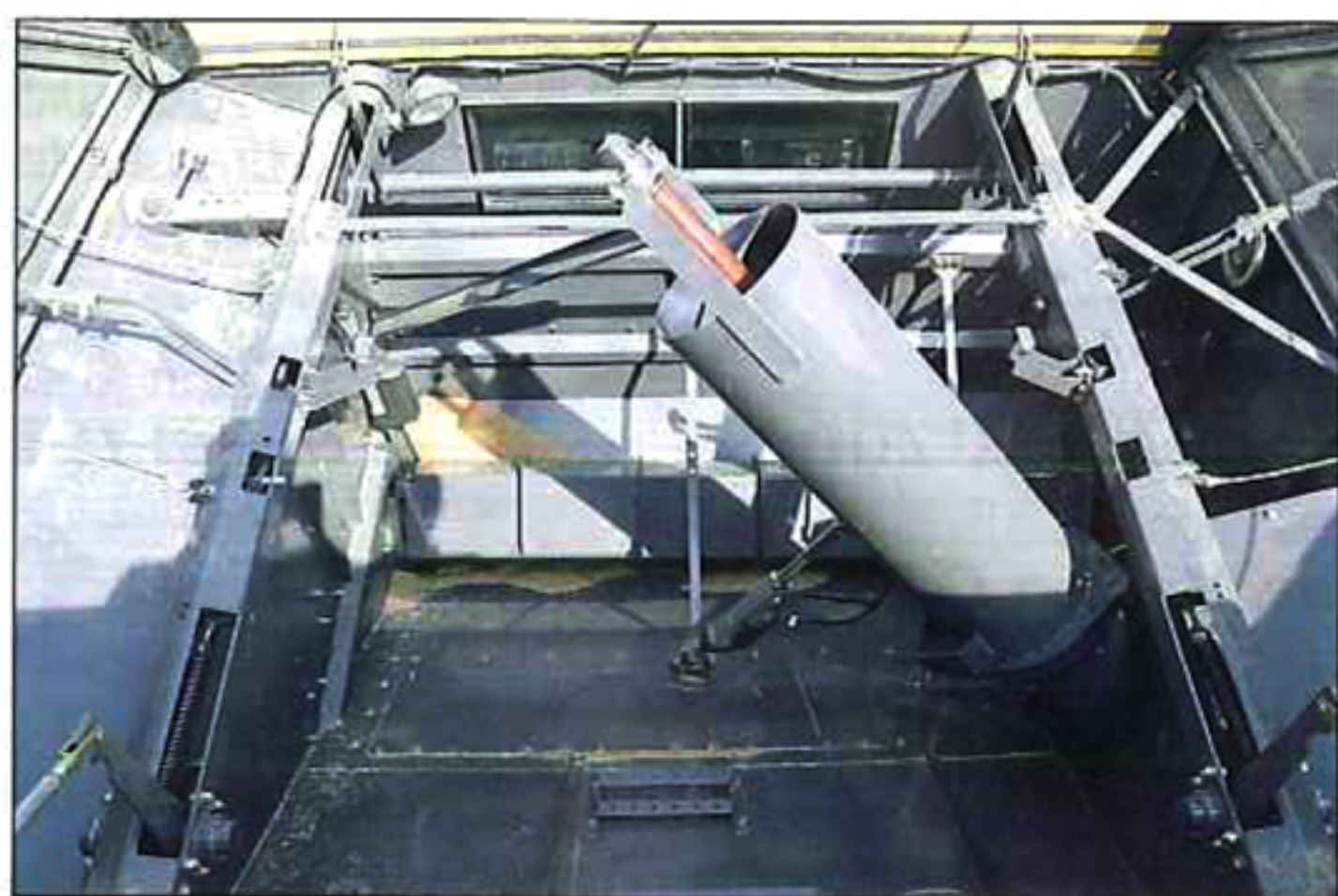
Blick in den Korntank.

Fendt will im Jahr 2013 in seinem Traktorenwerk Marktoberdorf 18.000 Einheiten produzieren. Nach Anlaufschwierigkeiten im neuen Werk habe man jetzt einen Tagesausstoß von 100 Traktoren erreicht, berichtete Fendt Pressesprecher Sepp Nuscheler anlässlich einer Pressekonferenz in der letzten Woche. Neben Maschinen, die noch mit einer Sperrfrist belegt sind, stellte Fendt hier seine neuen Mähdrescher, die X- und P-Serie vor.